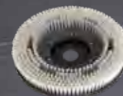
Bürste mittel 17" Art.-Nr. 210.230