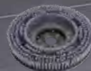
Bürste abrasiv 17" Art.-Nr. 210.227