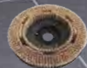
Bürste Rosshaar 17" Art.-Nr. 210.226

Fachhändler: Kaufmann Fördertechnik Vertrieb und Service GmbH Warener Str. 5 12683 Berlin Tel.: 030 / 53 88 100