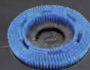
Bürste weich 17" Art.-Nr. 210.228

Werkzeugloser Bürstenwechsel: Die Bürsten verfügen über eine Schnellentriegelung und können sekundenschnell gewechselt werden. Für verschiedene Untergründe stehen Bürsten in verschiedenen Härtegraden zur Verfügung.